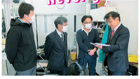
コロナ禍の中小業者の実態を聴取(2020年4月)