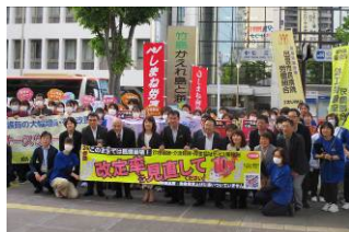
看護の日の集会に参加

医療、介護、保育、福祉の充実は、みんなの願い。社会保障予算を増やし、暮らしに安心を。