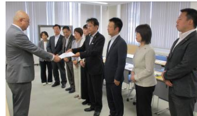
中国電力に申し入れる 県議団ら (2026年5月15日)

人々の笑顔と幸せを奪ったのが原発事故。「原発ゼロの松江」へ、力を合わせましょう。