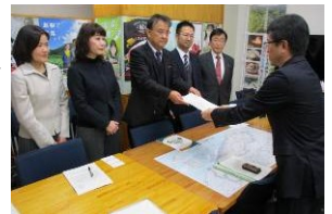
中海再生へ県に申し入れ