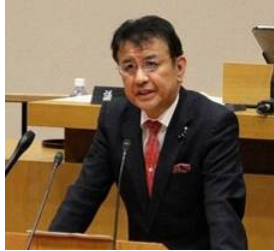
毎議会、質問に立つ