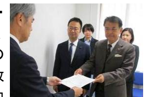
教員の増員を求めて教育委員会へ申し入れ

いじめや不登校が増える中、先生が子どもと向き合う時間を確保し、長時間・過密労働を解消するため、①教員の増員、②残業代の支給、③教職員の処遇改善、④全国学力テストの中止を求めています。